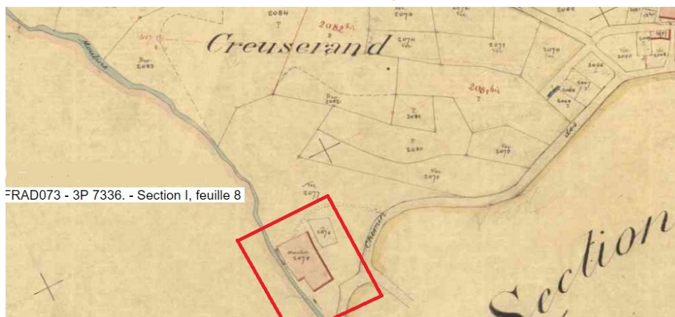
FRAD073 - 3P 7336. - Section I, feuille 8